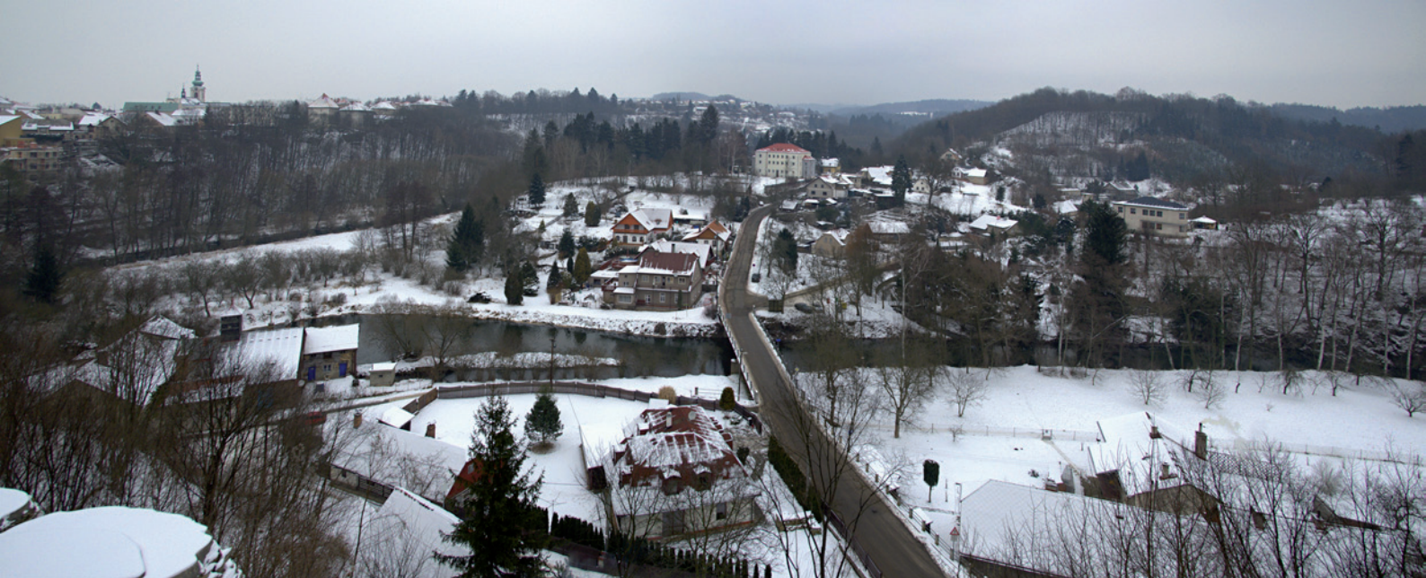
Nové Město nad Metují - Hradčany v zimě.