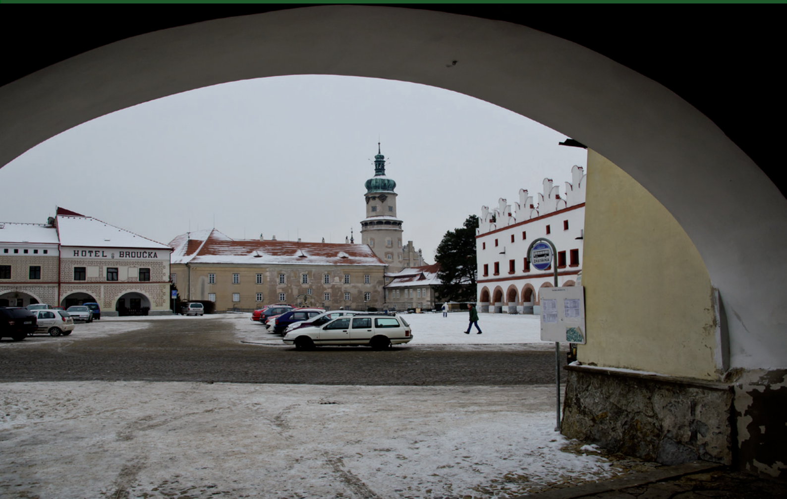
Nové Město nad Metují - pohled na náměstí se zámek z podloubí.