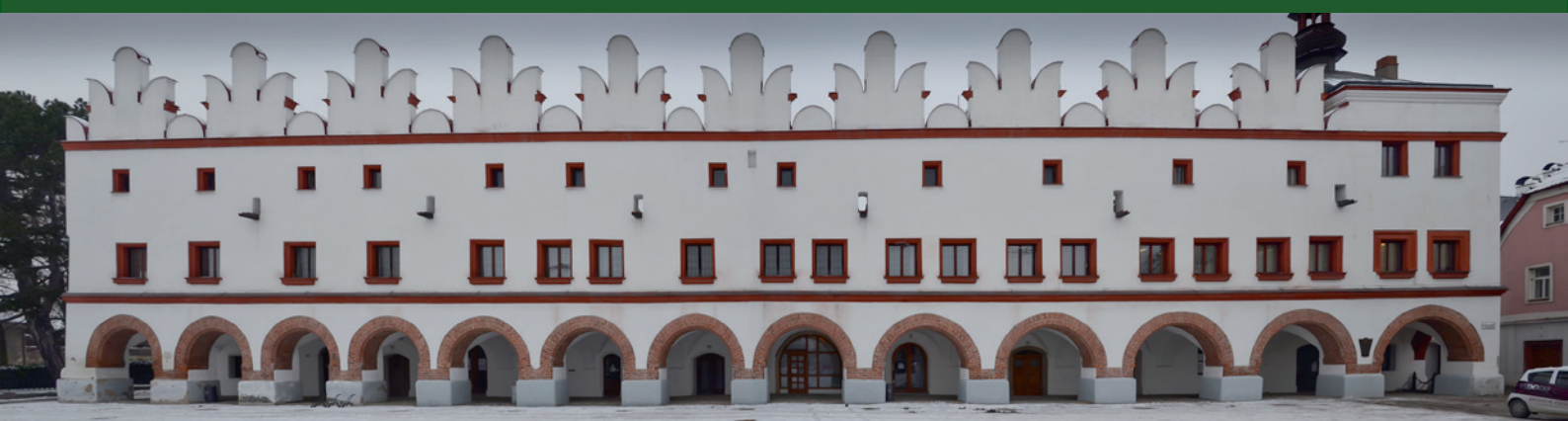
Nové Město nad Metují - renesanční štítový domů na náměstí.