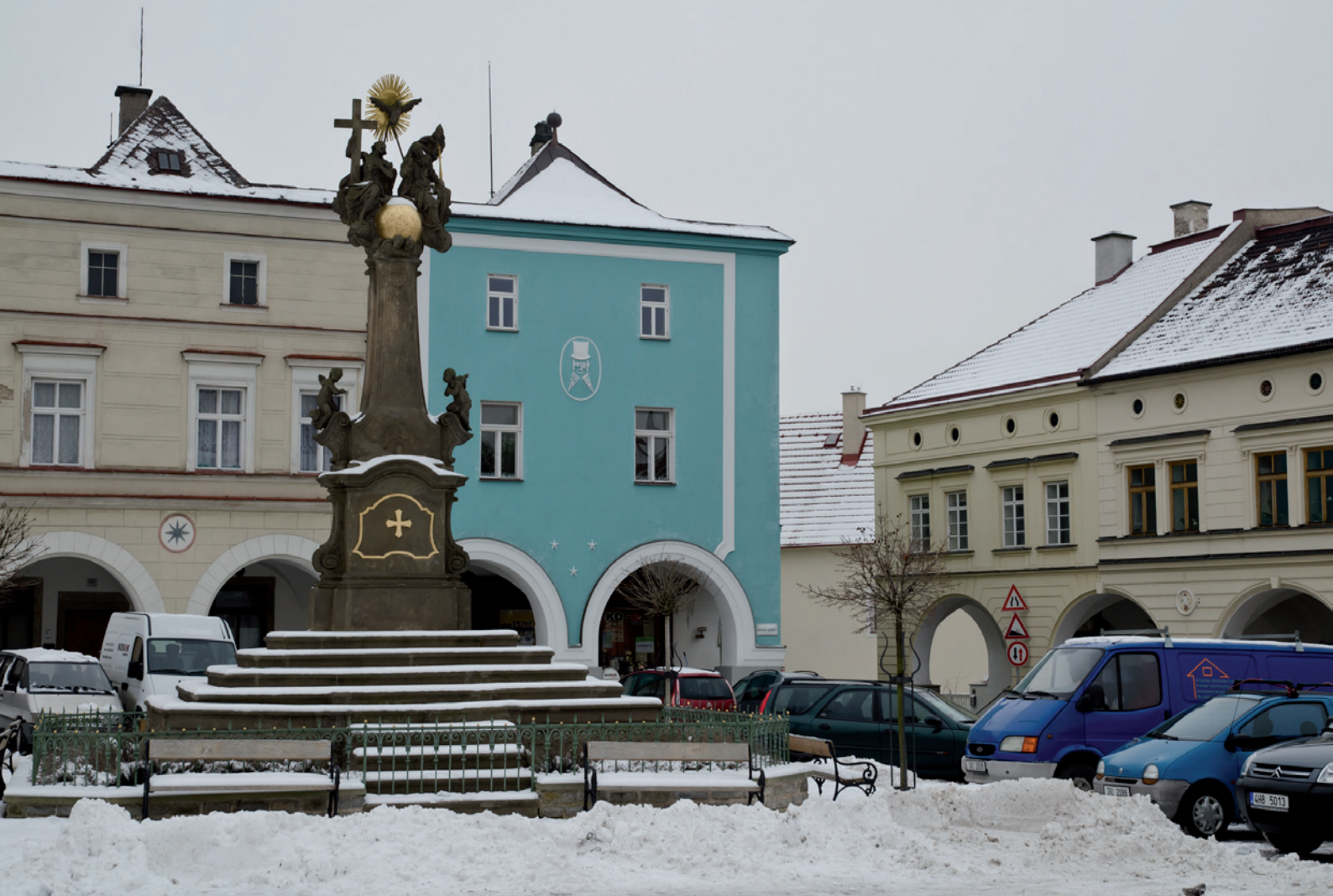
Nové Město nad Metují - horský výjezd z náměstí.