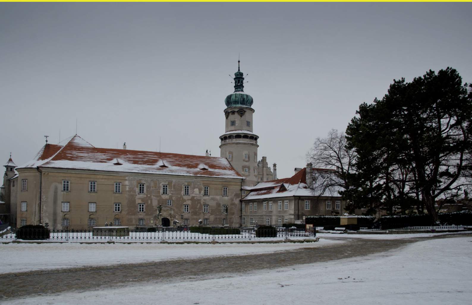
Nové Město nad Metují zámek v zimě.

ČLÁNKY - INFORMACE - AKTUALITY - NÁZORY- FOTOGRAFIE