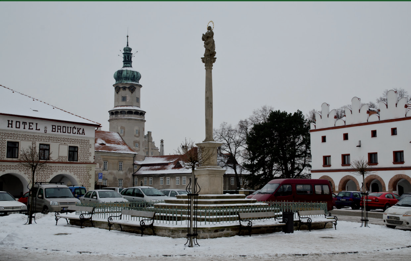
Nové Město nad Metují - náměstí se zámek v zimě..