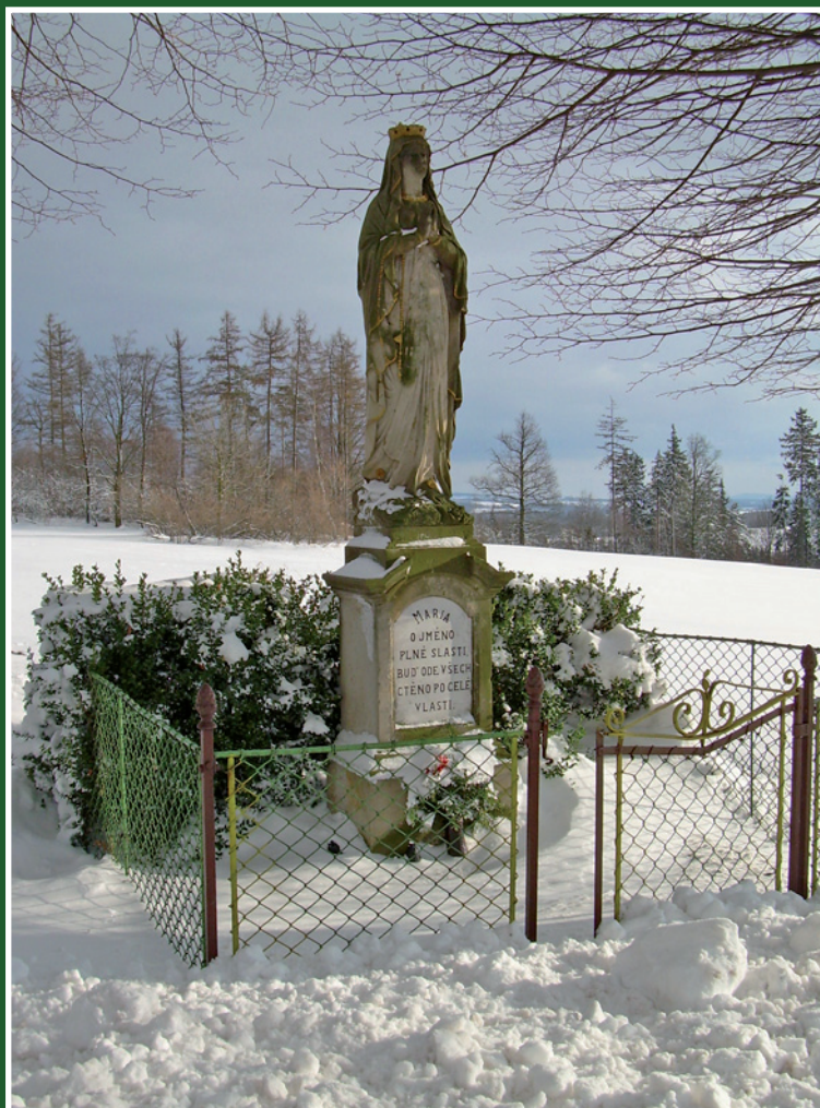
Socha Panny Marie u cesty na Přibyslav